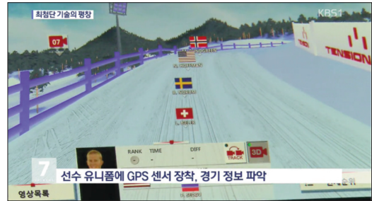
〈그림 3〉 홀로그램 구현 모습 (2018 평창올림픽 크로스컨트리)

홀로그램 기술은 물체의 표면에 반사시킨 빛을 통해 어느 각도에서 3D 입체영상을 보여주는 서비