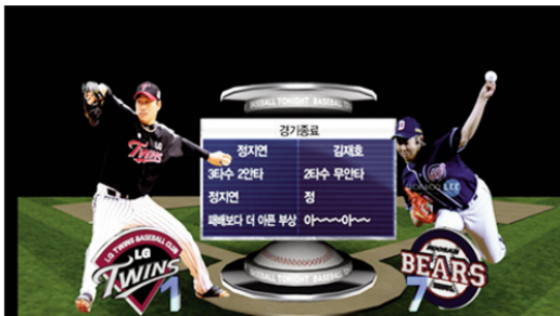
〈그림 1〉 VR 세트 적용사례 (KBS N 아이러브베이스볼)

방송 VR 콘텐츠 제작은, 일반 스튜디오 제작 시스템에 실시간 렌더링 그래픽 컴퓨터와 카메라에 부착된 엔코더가 VR 장비 그리고 크로마키를 생성할 수 있는 비디오 스위치의 크로마키어나 전용 키어로 구성된다. 또한 청색(Blue)이나 녹색(Green)으로 도색된 스튜디오가 필요하다. 따라서 시스템을 실현하기 위해서는 Virtual Studio + Blue/Green Chroma Set + Camera Data 등의 구성으로 이루어진다.