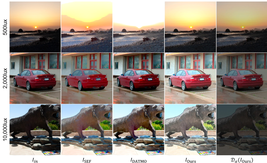
그림 2. 시인성 개선 알고리즘의 정성적 결과